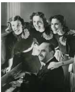
Sholem Secunda et les Andrews Sisters

Sources : en.wikipedia.org/wiki/Sholom_Secunda ; yidlid.org